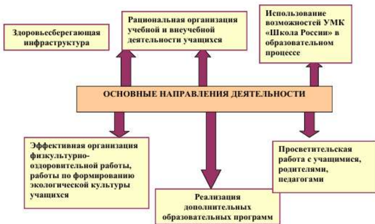
Рис.1. Основные направления деятельности.

Работа по формированию экологической культуры, здорового и безопасного образа жизни на ступени начального общего образования ведется по следующим направлениям: